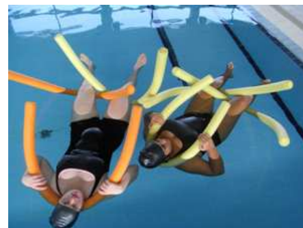
La terapia es relajante.

En cada sesión participan 5 usuarios de Adispaz los cuales rotan cada semana y se trasladan a las piscinas municipales de La Muela ya que La Almunia no dispone de estas instalaciones. Los resultados ya se están notando. “Duermen mejor, tienen más autocontrol de su