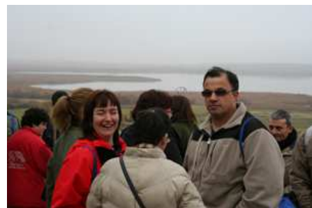
Varios usuarios, en la laguna.

Los veinte usuarios que visitaron este paraje procedían de las entidades Adispaz, Adislaf, y Afadi del CAMP. También viajaron con ellos dos autogestores del grupo de FEAPS Aragón. En total se juntaron en este espacio natural cerca de 50 personas. Los usuarios estuvieron acompañados por ocho monitores y por 20 voluntarios de la Fundación Mapfre.