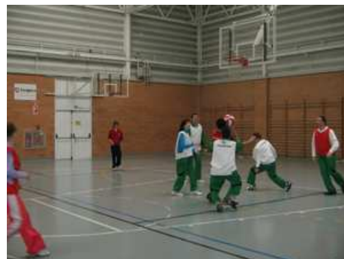
Los usuarios disfrutaron mucho de las actividades.

“El deporte es una oportunidad para superarse y para conocer a otras personas”, recuerda Villagrasa en uno