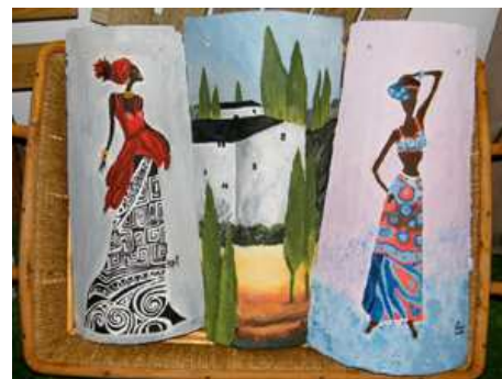
Uno de los cuadros de la muestra.

centro ha decidido vender al público los productos de esta muestra que se inauguró el pasado 19 de diciembre. Los más sencillos se entregaron al momento, mientras que los más elaborados se han podido recoger a partir del día 4 de enero al finalizar la exposición o bien realizando encargos en la misma sala durante los días de la muestra.