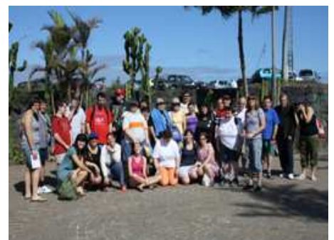
Un grupo de usuarios de un turno de FEAPS Aragón, en Tenerife.

En Isín el programa incluía una visita al Parque Pirenaarium, al Museo del Serrablo de Sabiñánigo y a la ciudadela de Jaca. En total había para esta convocatoria de tres turnos 55 plazas disponibles. Desde FEAPS Aragón agradecen “mucho” la disponibilidad que