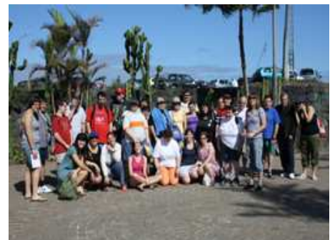
Un grupo de usuarios de un turno de FEAPS Aragón, en Tenerife.

En Isín el programa incluía una visita al Parque Pirenaarium, al Museo del Serrablo de Sabiñánigo y a la ciudadela de Jaca. En total había para esta convocatoria de tres turnos 55 plazas disponibles. Desde FEAPS Aragón agradecen “mucho” la disponibilidad que