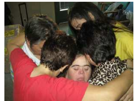
Padres e hijos se abrazan y aprenden a dar y recibir afecto.