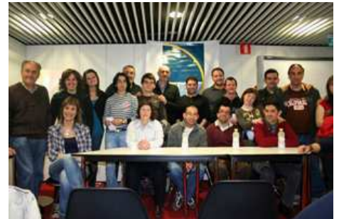
Foto de familia con los asistentes a la charla.