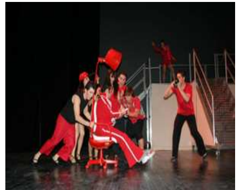
Un momento de la actuación.