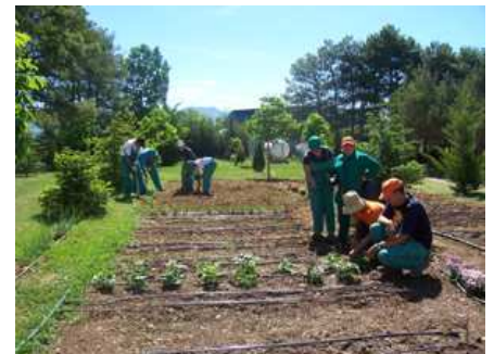
Los usuarios, en el curso.

Este curso permitirá impulsar el taller ocupacional del Centro Ignacio Claver de Atades Huesca, aprovechando los recursos naturales del entorno, potenciando el trabajo