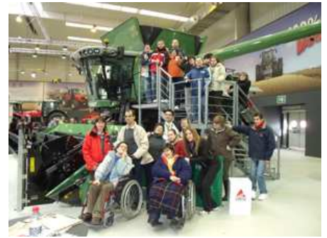
Los usuarios de Adispaz, en la Feria de Agricultura, en Zaragoza.

Esta es una de las oportunidades que aprovecha esta asociación –que es miembro de FEAPS Aragón– para estar presentes en la comunidad y normalizar la participación de las personas con discapacidad intelectual en la misma.