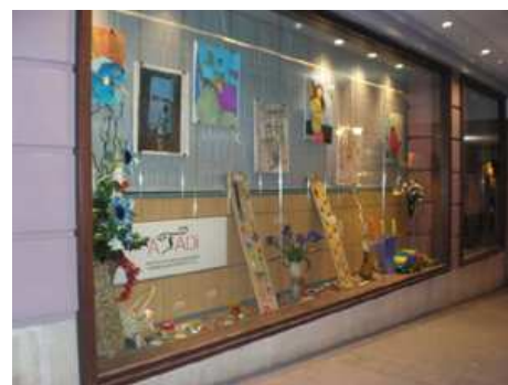
Los artículos de Atadi, en la Caja Rural.

Los organizadores de este V Encuentro valoran muy positivamente todos los actos programados y quieren agradecer especialmente la labor de los profesionales del Co-