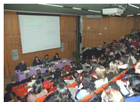
Varios ponentes en un momento del encuentro.

La reconciliación de las culturas. Eso es lo que pedían los alumnos y profesionales del Colegio Gloria Fuertes de Andorra en el Día Escolar de la Paz que celebraron el pasado 29 de enero. Fue una jornada de convivencia en torno a la interculturalidad con juegos, interpretación de coreografías y de canciones.