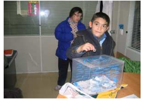
Un alumno, haciendo un donativo.

personas que forman parte de la Fundación CEDES con respecto al desastre de Haití ha sido enorme. “No deja de sorprendernos la solidaridad, el compañerismo y la empatía que muestran nuestros usuarios cuando se precisa colaboración para cualquier cosa”, explicaban responsables del centro ocupacional.